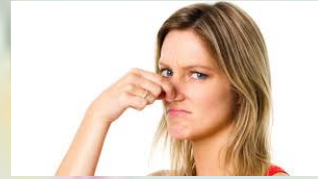
Iets wat vies ruikt