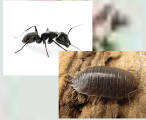
Mier of pissenbed