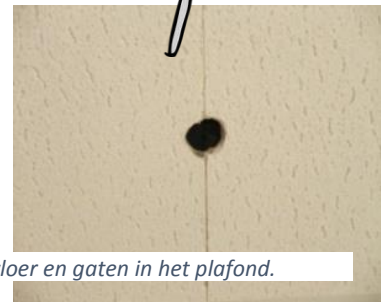
Mijn leerlingen zagen putten in de vloer en gaten in het plafond.