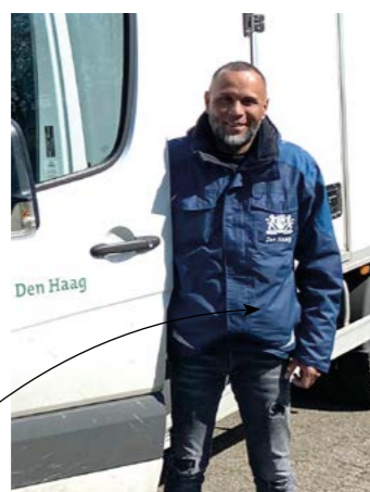
RUUD DEIRA transport en materiaalbeheer

Het hele aanbod voor jouw groep in één oogopslag. Ook handig om alle aanvragen binnen de school te coördineren. Laat elke leerkracht aankruisen wat hij of zij wil ontvangen en reserveer daarna in één keer via de website.